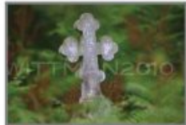
10 Cmentarz prawosławny w Sobiborze