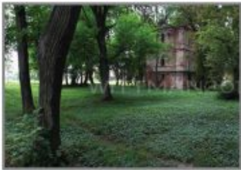
3 Park w Różance