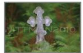
10 Cmentarz prawosławny w Sobiborze