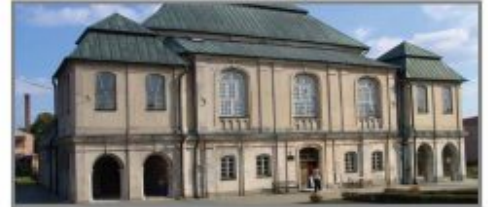
7 Muzeum Pojezierza Łęczysko-Włodawskiego we Włodawie