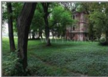
3 Park w Różance