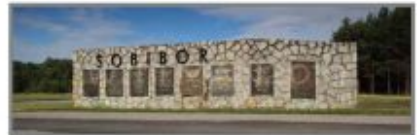
8 Muzeum Byłego Hitlerowskiego Obozu Zagłady w Sobiborze