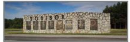
8 Muzeum Byłego Hitlerowskiego Obozu Zagłady w Sobiborze