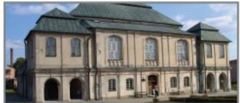
7 Muzeum Pejzaziera Łęczysko-Włodawskiego we Włodawie