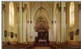
4 Kościół rzymskokatolicki p.w. Św. Augustyna w Różance