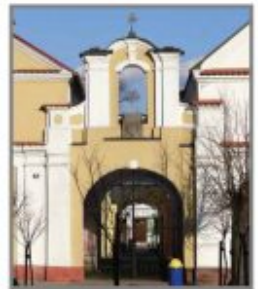
9 Czworobok we Włodawie