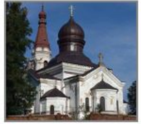
6 Cerkiew prawosławna Narodzenia Najświętszej Maryi Panny we Włodawie