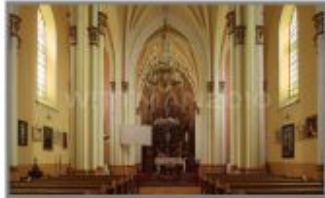
4 Kościół rzymskokatolicki p.w. Św. Augustyna w Różance