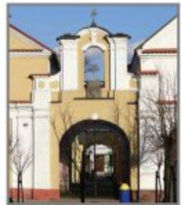
9 Czworobok we Włodawie