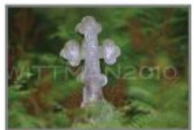
10 Cmentarz prawosławny w Sobiborze