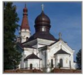
6 Cerkiew prawosławna Narodzenia Najświętszej Maryi Panny we Włodawie