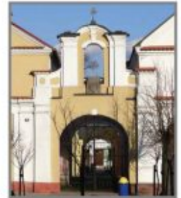
9 Czworobok we Włodawie