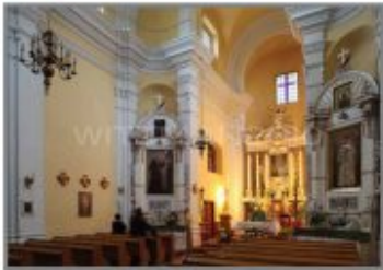
2 Kościół rzymskokatolicki p.w. Św. Jana Józefa w Orzechówku