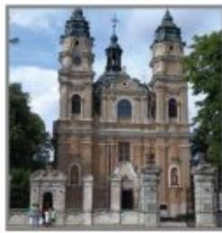
5 Kościół rzymskokatolicki p.w. Św. Ludwika we Włodawie