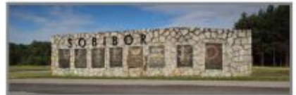
8 Muzeum Byłego Hitlerowskiego Obozu Zagłady w Sobiborze